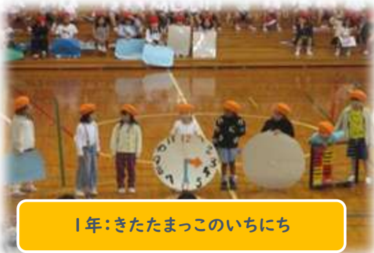
1年:きたたまっこのいちにち

この経験で得た「協力する心」や「達成感」を大切に、これからの学校生活でもさらなる飛躍を目指してまいります。引き続き、本校の教育活動へのご理解とご協力をお願い申し上げます。